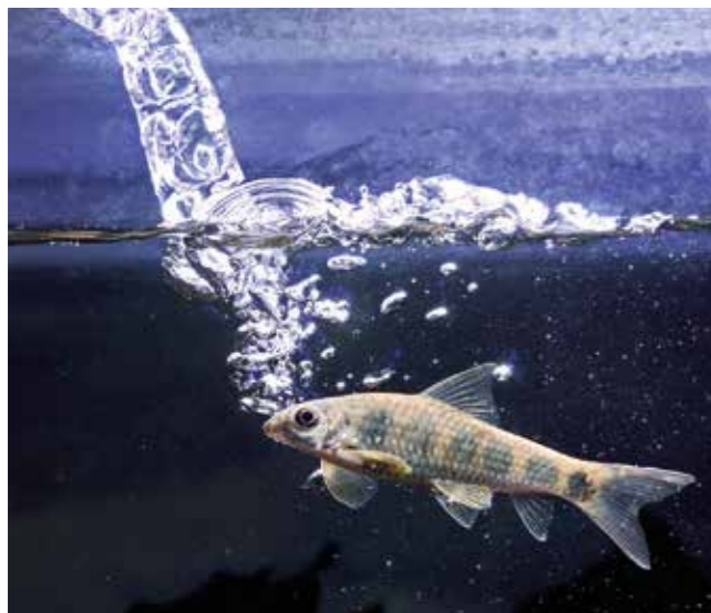
Selbst bei noch weiter über der Wasseroberfläche liegendem Auslass wird ein hoher Durchfluss erreicht; das Antriebsteil des gezeigten Lufthebers ...