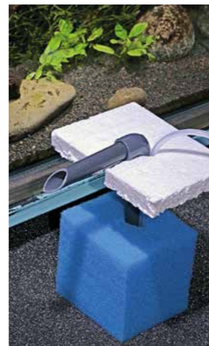
Einsatzbereiter Filter mit einem 16-mm-Luftheber; der neue Schaumstoff treibt anfangs auf, kann in den ersten Wochen aber auf verschiedene Weise arretiert werden

Warum überhaupt ein schwimmender Filter? Ich fand es ganz praktisch, Filter einzusetzen, die sich an ändernde Wasserstände anpassen, die teils nützlich sind, etwa bei der Zucht von Labyrinthfischen oder wenn man Ausbruchskünstler (wie Stachelaale) neu einsetzt, die auf keinen Fall aus Neugier als Trockenfisch enden sollen. Oder auch, wenn man bei einer nötigen chemischen Behandlung (z. B. von Blaualgen) aus schwäbischer Sparsamkeit die Kosten der Heilmittel durch die Reduzierung der Wassermenge senken will. Was natürlich nicht heißen soll, dass sich bei mir Blaualgen und andere Unliebsamkeiten die Klinke in die Hand geben, es soll nur verdeutlicht werden: Ein TLH, der sich unabhängig von einem schwankenden Wasserstand betreiben lässt, kann nützlich sein!