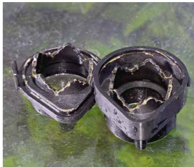
... wurde direkt nach der Aufnahme erstmalig auseinandergenommen – auch nach fünfmonatigem Betrieb und mit den gezeigten Ablagerungen lief der Luftheber noch sauber und ausreichend! Der Schmutz sitzt im Wesentlichen an den Rändern der Zähnen, weniger in den Aussparungen selber.

Glaswand und Schaumstoff keine allzu engen Spalten entstünden, die zur Todesfalle werden. Die Höhe der Filterblöcke betrug je nach Beckenvolumen zwischen 12 und 25 cm. Über zwei Drittel dieser Höhe wurde mit einem scharfen Messer ein Schlitz eingeschnitten, der zum Einführen des Steigrohres diente. Grundsätzlich eine sehr simple Methode, auch wenn die neuen Matten anfangs teils leicht auftrieben, nach Einlaufen lagen sie allerdings sehr gut im Wasser.