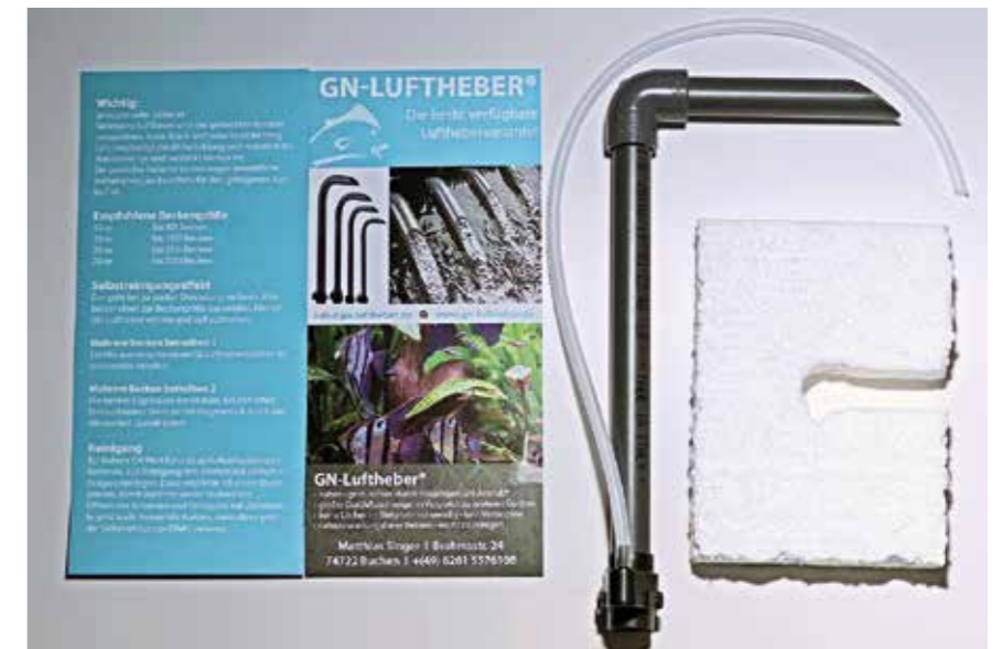
Der Flyer gibt eine praktische Übersicht; rechts der rustikale Schwimmer Marke „Eigenbau“

Die Umsetzung dieses Vorhabens war leicht – als Schwimmer dienten rechteckige, 2–3 cm dicke Styroporstücke, die ja nach Becken- und Filtermattengröße zwischen 10 x 10 cm und 15 x 15 cm maßen. In diese schnitt ich Aussparungen ein, deren Breite etwas geringer war als der Durchmesser von Steig- und Auslaufrohr. Das Steigrohr wurde dann einfach mit sanftem Druck durch diese Aussparung einge-