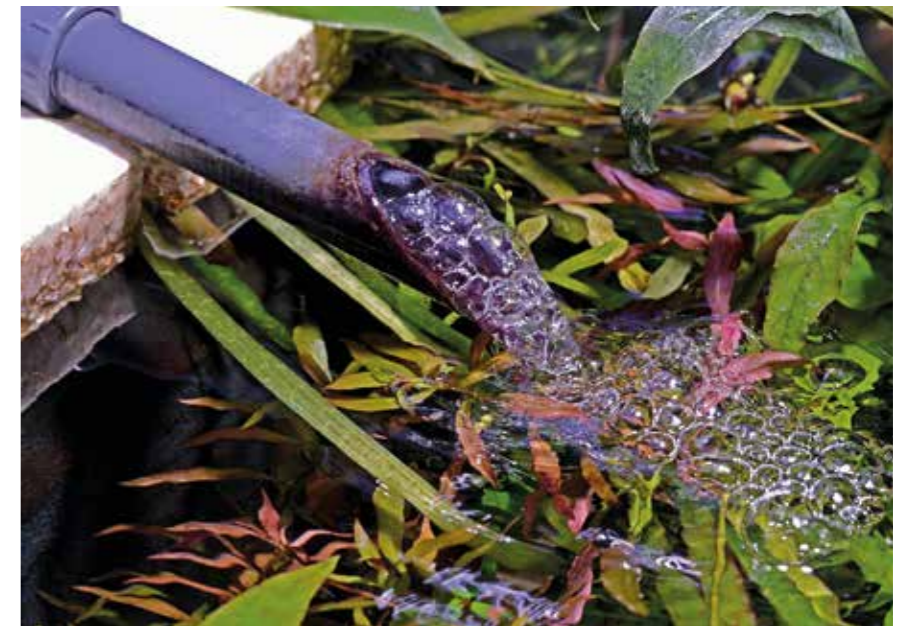
Blick auf das Auslassrohr, das aufgrund des Schwimmers über der Wasseroberfläche liegt – feingepert wird dennoch

Die aus einer Filtermatte erhaltenen Schaumstoffblöcke schnitt ich in etwas kürzeren Längen und Breiten zurecht als die jeweils verwendeten Schwimmer aus Styropor: Damit sollte sichergestellt sein, dass zwischen