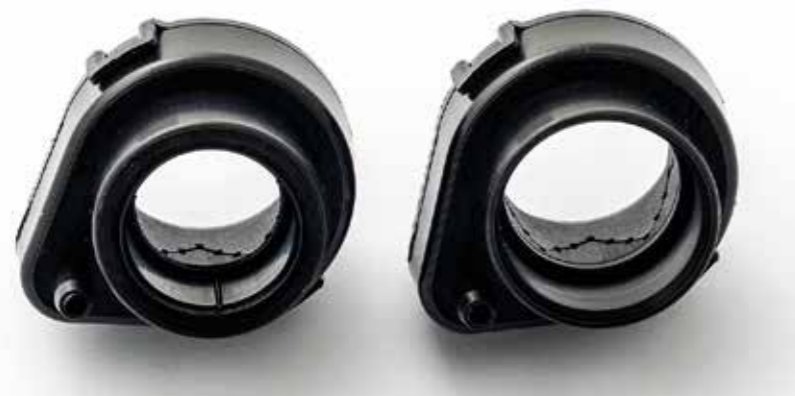
Die Besonderheit ist das Antriebsteil, das aus zwei steckbaren Einzelteilen besteht